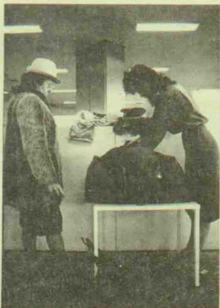
Vámvizsgálat Ferihegyen. Valamit az állam is keres

Aligha lehet vitatkozni a PM-tájékoztató elhangzott azon megállapítással, hogy az egészségtelen mértékű bevásárlóturizmus leghatásosabb gyógymódja a külkereskedelmi forgalom, az import liberalizálása. Csak hogy az idén a konvertibilis elszámolású import 40 százaléka kiterjedő liberalizációból csupán egy töredék jut a fogyasztási cikkekre, s minden behozatalt tovább drágít a forint leértékelése. A jelenlegi piaci hely-